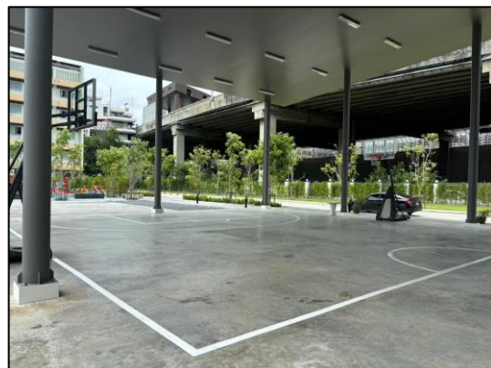
รูปที่ 1.3-1 สภาพปัจจุบันของโครงการ ระหว่างเดือนกรกฎาคม-ธันวาคม พ.ศ. 2567